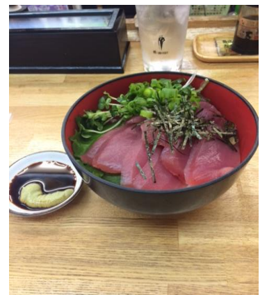
お勧めメニュー「鉄火丼」

店名：魚庭（ナニワ）の立ち寿司 住所：城東区今福西1-8-14 電話：06-6939-3491